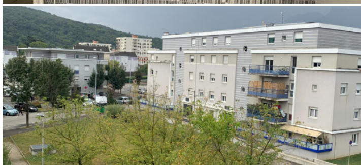
Location · appartement